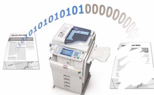
Sovrascrittura dei dati sul disco fisso

Le funzionalità di autenticazione e codifica dei dati proteggono le informazioni riservate. Aficio™MP C2050 e Aficio™MP C2550 sono compatibili con sistemi di sicurezza opzionali che permettono la sovrascrittura dei dati sul disco fisso, la protezione dei dati contro la copiatura, l'autenticazione tramite card e l'autorizzazione alla stampa.