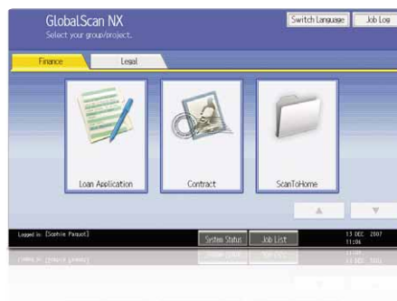
Interfaccia grafica (GUI) intuitiva

La soluzione intuitiva GlobalScan NX razionalizza il flusso di lavoro grazie a funzionalità flessibili di scansione e distribuzione. L'interfaccia grafica utente (GUI), molto facile da utilizzare, consente di memorizzare delle icone con impostazioni personalizzate relative al formato ed al flusso dei documenti. Dal pannello di controllo di Aficio™ MP C2050 e Aficio™ MP C2550 è possibile eseguire direttamente scansioni in un solo passaggio.