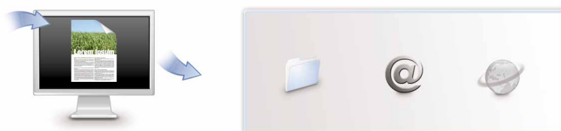
Pulsante per le funzioni "Scan to e-mail", "Scan to folder" e "Scan to URL"